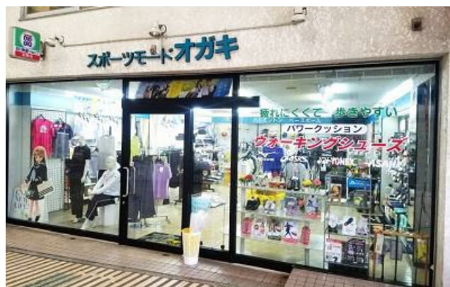
スポーツモードオガキ