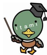
伊丹市マスコット たみまる

伊丹市では、震災の教訓をふまえ、安全安心なまちづくりを推進するため、住まいの耐震化を促進します。この制度は、住宅の耐震改修工事を行う方に対して、兵庫県の「わが家の耐震改修促進事業」の補助制度に加えて補助を行うものです。